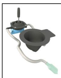
Kit ricircolo per risciacquo del vaso

Colori: Verde , Blu ; altri colori su richiesta; possibilità di personalizzazione.