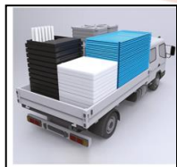
Ottimizzazione volumi di ingombro per il trasporto: 20'DV=35 bagni 40'DV=70 bagni Truck 90/120 m³/090/120 bagni smontati