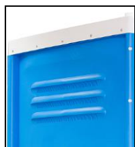
Finestrelle per areazione