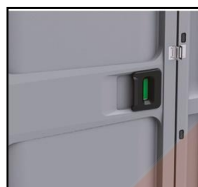
Chiusura con chiavistello con segnalazione libero occupato